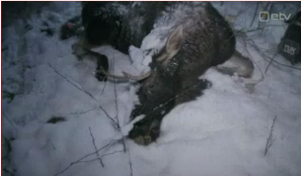
Pull Priit kaelustamise hetkel

Teate kõik, et kütitakse pulle 2+2 , kellel vanust 3,5 või 5,5 või isegi veel rohkem. Kust see tuleb? Praktikas on saanud selgeks nende kaelustatud pullide näitel, kus eksimust ei saa olla. Nimelt pull Priit olid esimene aasta „leistangid "kusjuures kasvasid ette (2016) .Kaasas ka pilt. Teisel aastal ilusad 2+2 sarved, erandina väikesed müksud mõlemal pool aga täiesti külgedele kasvavad ja ühtlased sarved (2017). Kolmandal aastal (2018) tall peas klassikalised 3+3 sarved ja väga ilusad ja ühtlased. Neljandal aastal (2019) aga oli tall peas 2+2 sarved ,puudus keskmine kolmas pulk . Ehk täpselt selline sarv nagu oli Markol kütitud 3,5 aastane ja väide oli , et õige. Viiendal aastal(2020 ) aga oli Priidul peas jälle klassikaline 3+3 sarv, kusjuures ilus ja võimas . Panen ka pildi kaasa.