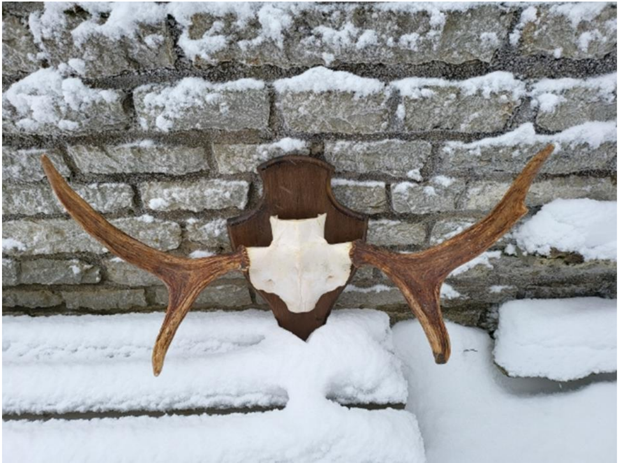
Marko põder – 3,5 aastat – ÕIGE PULL