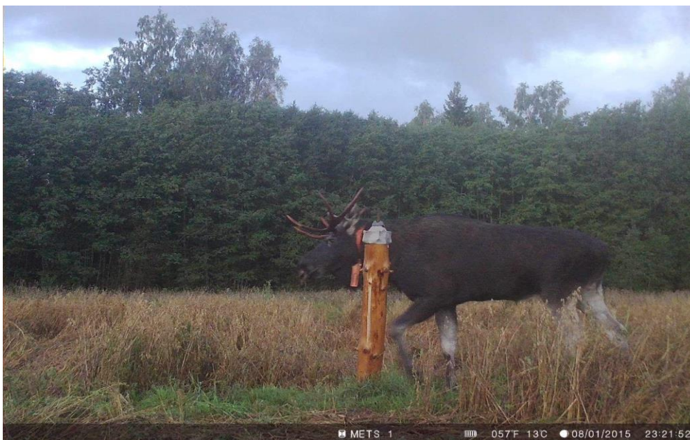
Pull Priit 5,5 aastasena